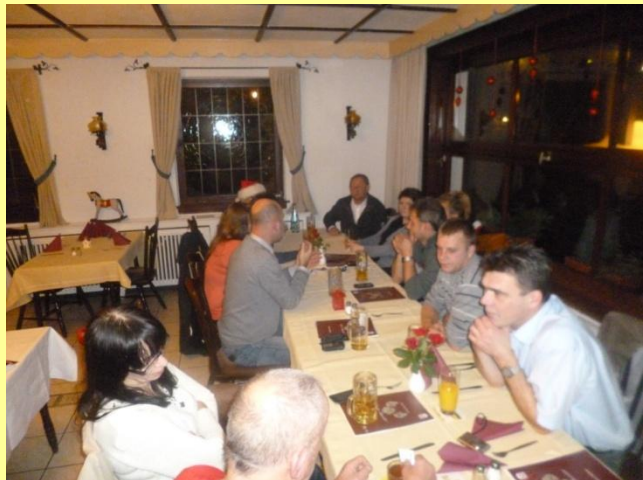
Abends gemeinsames fixes Abbauen, anschließend wurde noch in gemütlicher Runde im Gasthaus „Rudolph“ einen „Absacker“ genossen.