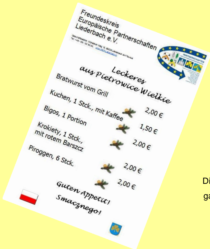
Diese leckeren Sachen gab's am polnischen Stand